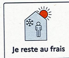
Je reste au frais