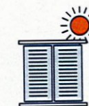
Je ferme les volets et fenêtres le jour, j'aère la nuit