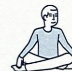
Je fais des activités sans effort