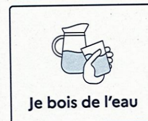
Je bois de l'eau