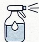
Je mouille mon corps