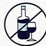
J'évite de boire de l'alcool